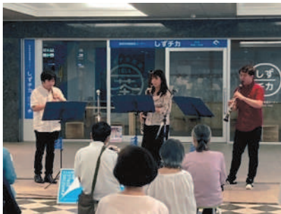
過去のまちかどコンサートの様子